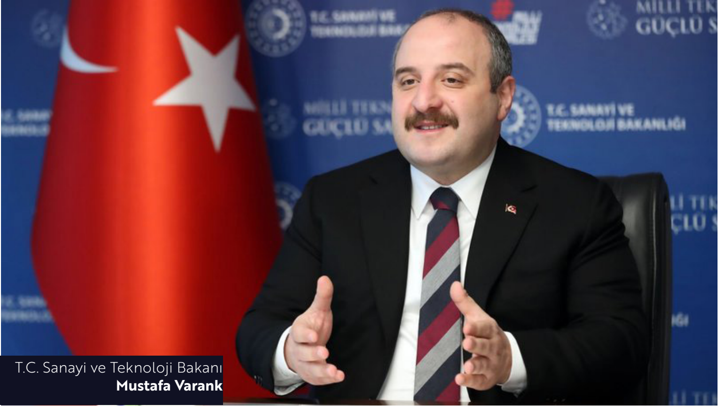
T.C. Sanayi ve Teknoloji Bakanı Mustafa Varank