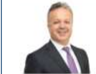
İSMAİL ÖZLÜ PRESIDENT OF TURKISH EXPORTERS ASSOCIATION

Diverging Points of Biotech and Sinovac Vaccines: Vaccines, which are the greatest hope to go back to the old normal from the pandemic conditions, are continuing to be sold all across the globe. Right now the number of vaccinations around the world are over 800 million. The most common 5 vaccines are "Pfizer-Biontech" based in Germany, "Moderna" based in US, "Sputnik V" based in Russia, "Sinovac" based in China and "Oxford-AstraZeneca" based in UK and Sweden. Biotech and Sinovac being the ones that are used in our country. Thus, in our country it is thought upon which of these two vaccines should be preferred.