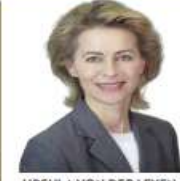
URSULA VON DER LEYEN AVRUPA KOMİSYONU BAŞKANI

Sektörün içinde geçirdiğim çökerek aşır içinde sektörün farklı evrelerine, gelişim süreçlerine tanık oldum. Sektörün yol alması, gelişmesi ve küresel entegrasyonun sağlanması için en doğru adres her zaman UTİKAD oldu ve olmaya devam edecektir.