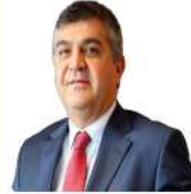
FARUK KAYMAKCI DIŞİŞLERİ BAKAN YARDIMCISI

"MovieLala tam bir Silikon Vadisi rüyası yaşıyor. Zamanında Facebook'un ilk zamanlarında yaptığı ve Social Network filmindeki gibi beş odalı havuzlu bir evi ofis olarak kullanıyoruz"